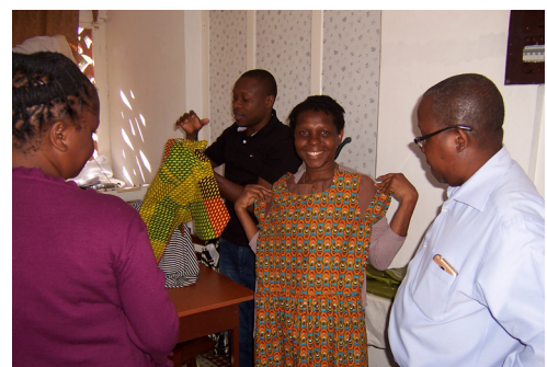
Impressionen aus dem ersten Nähkurs